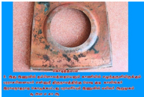
கொடித்தம்பம் 2. இது இணுவில் தம்பிளாவத்தையையும் காணியில் எழுந்தருளியிருக்கும் பரராஜசேகரப்பிள்ளையார் எனினுத் திருநாமத்திற்கு மெஷு குடி காலிங்கர் இராமநாதராக கொடுக்கப்பட்டது பராமரிப்பும் இணுவில் மலிவர் ஆறுமுகம் க. அள எ சா ஆ

இணுவில் பரராஜசேகரப்பிள்ளையார் கோவிலில் கொடித்தம்ப கவசம் செப்புத் தகட்டால் அமைந்துள்ளது. அதில்வரும் சாசனப்பகுதி பின்வருமாறு அமைகின்றது.